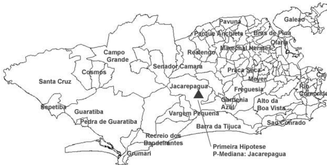
Figura 5: solução do heliponto para o caso particular dos 27 bairros

Considerando o critério utilizado para seleção dos bairros, o resultado matemático não ofereceu nenhuma surpresa quanto ao resultado esperado. O bairro de Jacarepaguá representa uma espécie de centro geográfico da rede projetada. Como decorrência desta condição particular, o programa confirmou esta localização como possível bairro para o heliponto temporário, recomendando-o para basear a aeronave durante o curso da missão policial, objeto deste estudo. Sem qualquer influência no processamento, mas tornando viável a escolha desenvolvida pela modelagem matemática, Jacarepaguá já dispõe de aeroporto alternativo, podendo receber aeronaves de médio porte e dotado de infra-estrutura para basear helicópteros civis ou policiais.