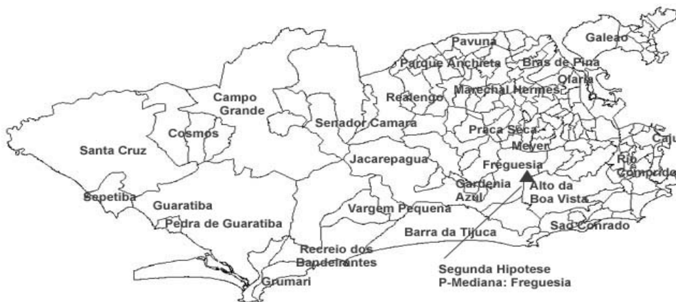
Figura 13 - Solução do heliponto para o caso dos 27 bairros com ponderação

O centro geográfico deste novo cenário deslocou-se na direção nordeste do município, fixando-se no bairro de Freguesia de Jacarepaguá. Alguns bairros com grande volume de ocorrências, tais