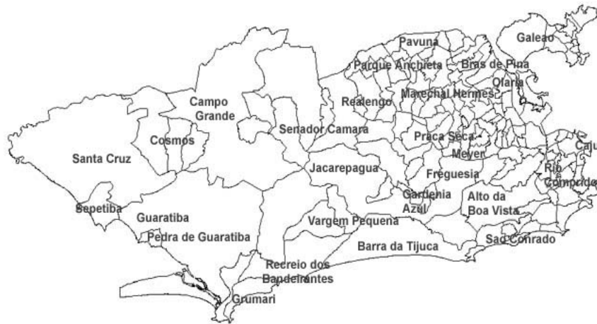
Figura 1 – Mapa físico do município do Rio de Janeiro e bairros selecionados para o estudo

O problema foi segmentado em duas hipóteses. A primeira desconsidera a incidência relativa de delitos nos bairros selecionados, levando em consideração apenas o menor somatório possível dos tempos de vôo para chegada da aeronave aos pontos de destino. A segunda hipótese acrescenta ao problema um indicador de violência, utilizado com frequência em sistemas de segurança pública, combinando o histórico de delitos de média e alta gravidade relacionado com a população residente para cada um dos bairros selecionados.